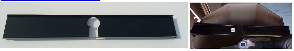
充填口固定用棚 コンテナ上部設置例