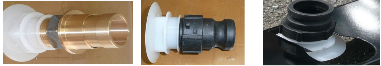
町野式バルブ65A♂, ♀ X 50Aガス カムロック 50A 固定用棚に取付