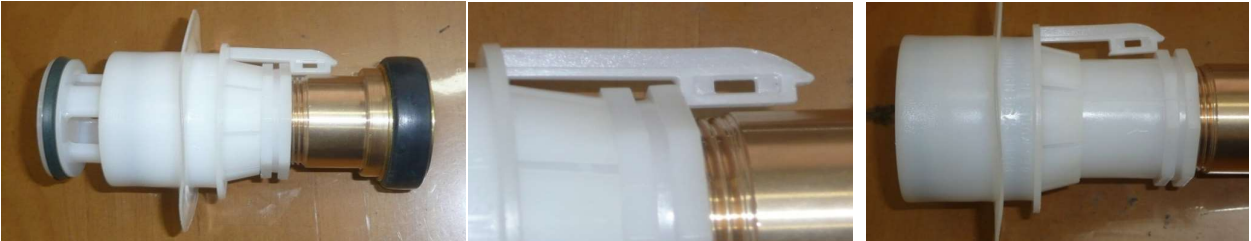
排水時のストッパーの位置 ストッパーを固定する。(排水時) 止水時のストッパーの位置 →

EZバルブでは、排水時にストッパーを固定します。コンテナより排水時に、水圧にて、バルブに圧が掛り排水を止める可能性があり、その為に、写真の様にストッパーを完全にセットする必要があります。