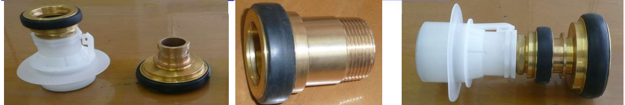
町野式バルブ ワンタッチ式 40AメスX40Aガスネジ 町野式バルブ 40A♂X65A♀