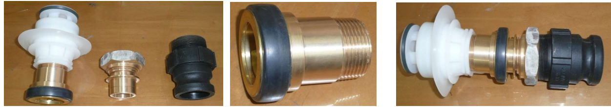
町野式40A♂X50Aガスネジ カムロック50A ワンタッチ式