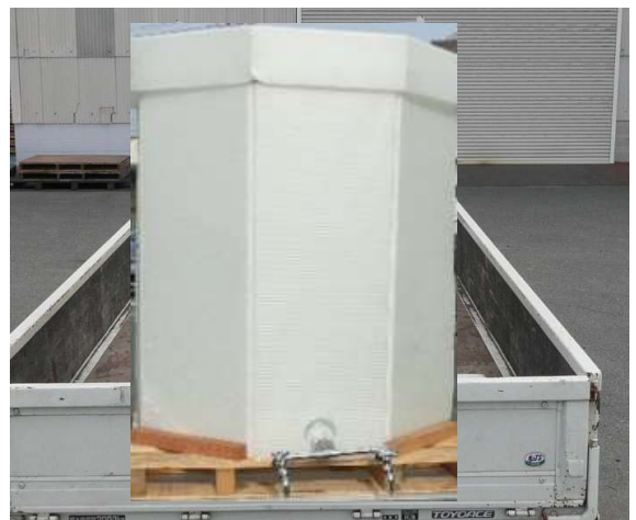
普通トラックに積載したLCコンテナ

● 普通トラックに給水車代行時の積載。給水車不足時に対応して給水車の補充が可能。