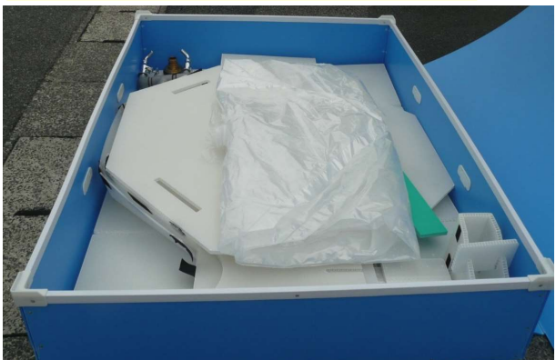
④ 架台、天板収納、パルプ類、受台、充填口固定柵を収納