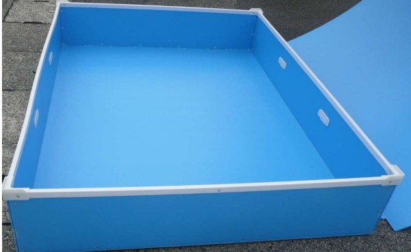
① 蓋を取り、収納スペース確認