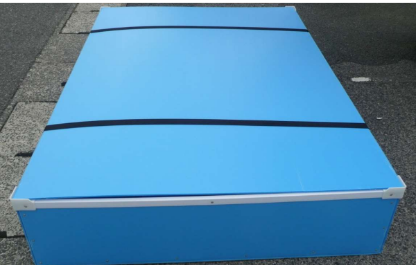
⑤ 収納箱に蓋をし、ベルトにて固定